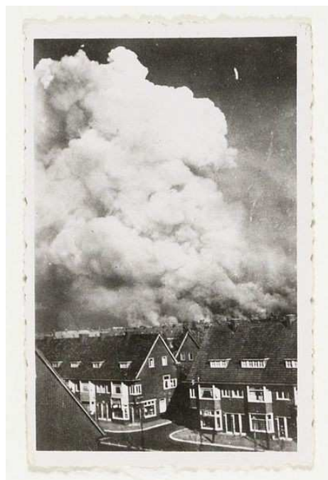
Voor de intocht van de Duitsers werden de olie- en benzinevoorraden in de Amsterdamse haven in brand gestoken. De op het Noordzeekanaal voor anker liggende vissersschepen voorkwamen het landen van Duitse watervliegtuigen.

© Piet J. Kroonenberg. Amsterdam februari 2008.