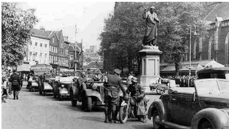
Duitsers op de Grote Markt in Haarlem

In Noord - Holland was het vrij rustig, behalve dan dat Schiphol en het vliegveld bij Bergen werden gebombardeerd en natuurlijk ook de marinebasis in Den Helder. Doch in de omgeving van Haarlem gebeurde niet veel al hoorde men op afstand wel het luchtafweergeschut van IJmuiden dat regelmatig in actie kwam tegen vliegtuigen die magnetische zeemijnen in de havenmond, buiten de pieren en in Noordzeekanaal wierpen. Nederlandse en buitenlandse zeeschepen die in de haven van Amsterdam lagen gooiden de trossen los en probeerden via het Noordzeekanaal en sluisen IJmuiden naar zee te gaan. Honderden, vooral Joodse, medeburgers probeerden aan boord te komen, ook van vertrekkende vissersschepen, om zo het land te ontvluchten. Ook die schepen werden, tot ver op open zee, aangevallen door de vliegtuigen, die ze met mitrailleurvuur en bommen bestookten. Maar Haarlem werd niet door het oorlogsgeweld getroffen.