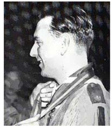
De zilveren wolf

In juni 1936 was de Royal Albert Hall gedurende 7 avonden totaal uitverkocht. Met busladingen vol kwam het publiek uit heel Engeland. Op de eerste avond, waarbij de Baden-Powells en hun kinderen aanwezig waren, kreeg men na de grote finale een donderend applaus en dit herhaalde zich iedere avond. Zo zeer dat men besloot de show in 1938 te herhalen. Weer met groot succes. Gevolg was dat er in de zomer van 1939 opnieuw werd gewerkt aan een herhaling. Maar het uitbreken van de 2e Wereldoorlog in september 1939 betekende uiteraard ook het einde van BOY SCOUT.