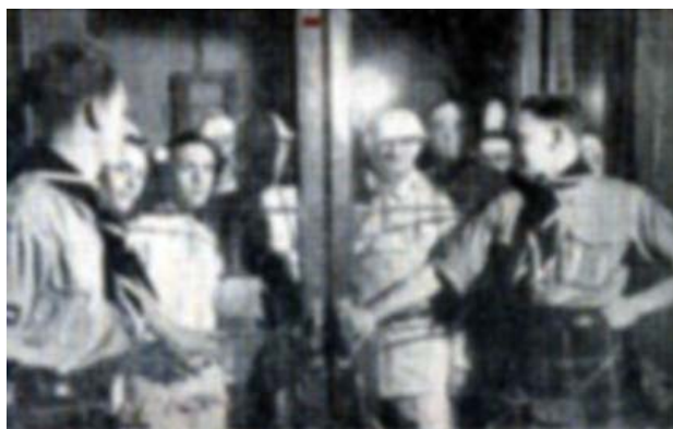
De honderden 'Ghosts' wachten op het moment waarop zij via de trappen de arena kunnen betreden.