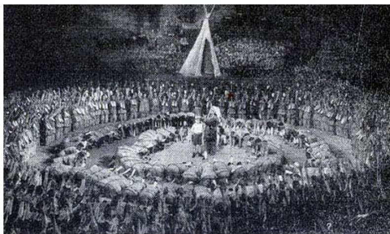
Rondom de Boy en het Opperhoofd, de dans en de song van de indianen