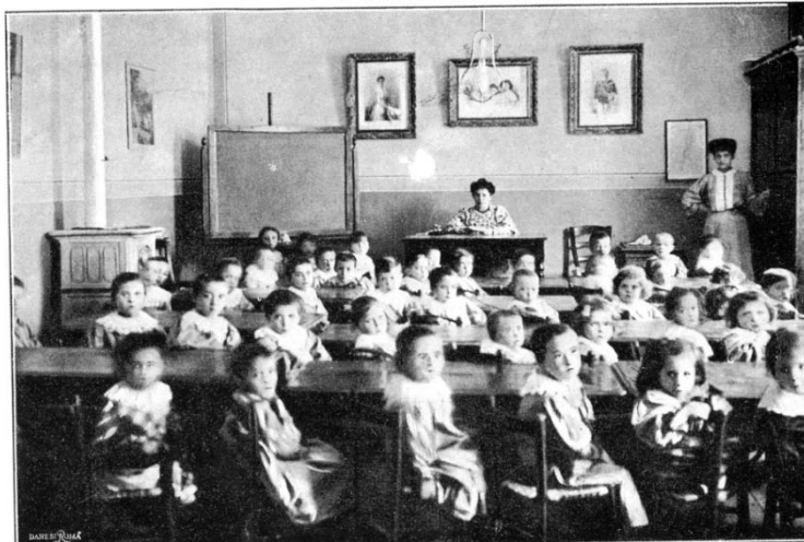
Aanvankelijke inrichting van een Casa dei Bambini