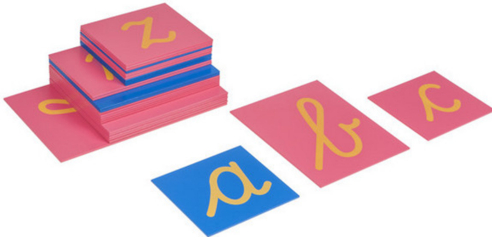
Montessorimateriaal vervaardigd door Heutink. De schuurpapieren letters.