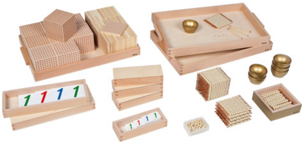
Montessorimateriaal vervaardigd door Heutink. Het gouden materiaal.