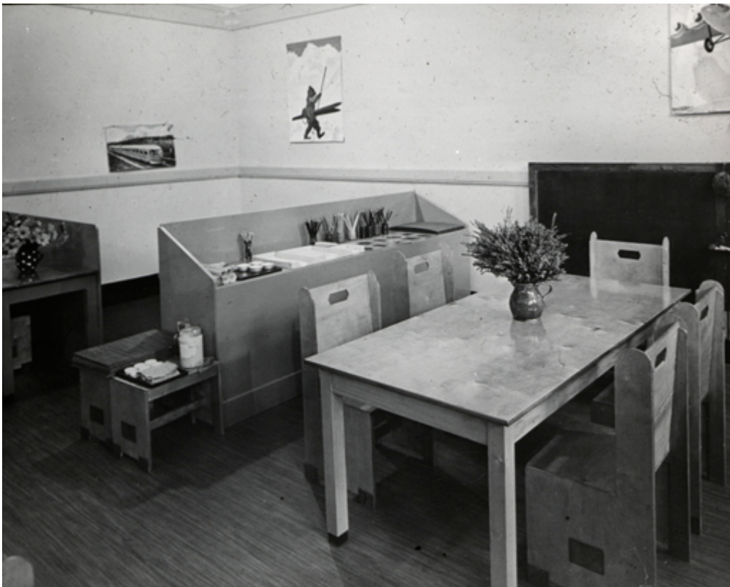
Voorbeeld van de inrichting van een kleuterklas