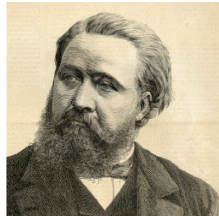
Desiré Magloire Bourneville