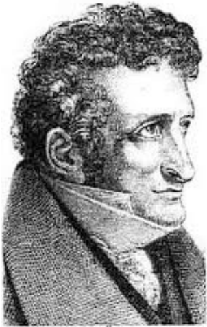
Jean Marc Caspar Itard