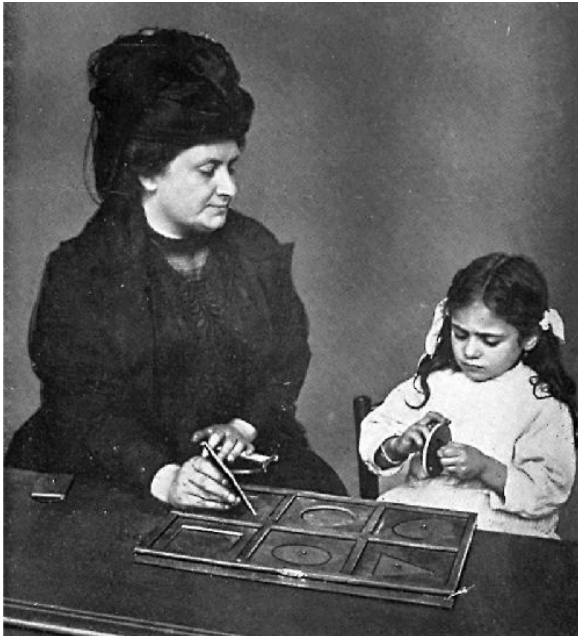
Maria Montessori werkt met een kind