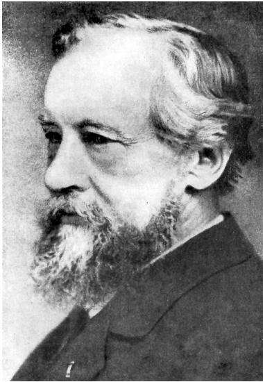
Hugo de Vries