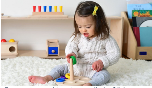
Een peuter werkt met voor die leeftijd aangepast materiaal

ze wereldberoemd werd. In Het brein van het jonge kind heeft Maria Montessori de opvoeding van 0 – 3-jarigen gedetailleerd beschreven.