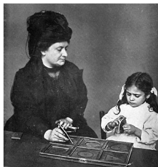
Maria Montessori geeft een kind een lesje.

ook heel grote met meer dan duizend leerlingen.