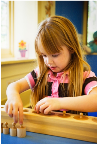
Kleuter werkt met cilinderblok

Wel wordt de vrijheid beperkt door de groep. Er zijn bij voorbeeld slechts enkele exemplaren van een bepaald soort materiaal aanwezig. Wordt dit materiaal al door anderen gebruikt, dan moet de leerling wachten en een andere keus maken. Bovendien kan de leraar de vrijheid van het kind beperken, als het voor de groep of het kind nodig is. Soms is het heel stil in een Montessori-groep. Met de jongste kinderen worden er ook stillelessen gedaan. Maar meestal heerst er een geroezemoes. Een aantal kinderen werkt alleen; er zijn groepjes, die samenwerken en de leraar geeft weer andere kinderen lesjes (korte instructies bij voorbeeld). Dé Montessorimethode bestaat niet. Montessori heeft nooit een leerboek voor kinderen geschreven.