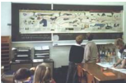
Montessorikinderen in Nederland bestuderen de Tijdlijn van het Leven.

In Nederland en andere landen zijn er ook nationale opleidingen, soms verbonden aan Hogescholen. Bij het in werking treden van de Wet op het Basisonderwijs op 1 augustus 1986 telde Nederland 114 Montessori-basisscholen, verspreid over het gehele land. In 2022 waren dat er 159. Over de hele wereld zullen er zo'n 25.000 Montessorischolen staan, die werken volgens de richtlijnen van de Association Montessori Internationale [AMI]. Dat zijn heel kleine schooltjes met iets als tien leerlingen. Maar