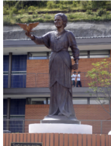
Montessorischooltje in de huiskamer van De Binckhorst in Laren. Rechts een heel grote Montessorischool in Mexico. Let op de twee jongen in witte overhemden.

Buiten Europa o.m. in Canada, de Verenigde Staten, Pakistan, India, Sri Lanka, Japan en Mexico. In de meeste van deze landen is het ook mogelijk om door de AMI georganiseerde cursussen te volgen.