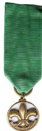
Dankbaarheidsinsigne Nationale Padvinders Raad

In 1935 volgde ook de NPV, de Vereniging de Nederlandsche Padvinders. Een Pijlkop met daaronder een lint waarop: De Ned. Padvinders Ten tijde van de 5 e Wereldjamboree van 1937 in Nederland werd dit veel uitgereikt, maar dus niet aan leden. Daar kort na de zeer succesvolle Jamboree, de Katholieke NPV-leden opdracht kregen van het Episcopaat de NPV te verlaten en een aparte, zuiver RK vereniging te vormen, werd, om te voorkomen dat zij buiten Wereldscouting zouden komen te staan, de Nationale Padvindersraad gevormd. Deze werd op 28 mei 1938 geïnstalleerd. Van toen af aan werd het Dankbaarheidsinsigne namens deze Raad verleend. Op het lint stond toen Nat. Padvindersraad. Deze versie is hiernaast afgebeeld. [Met dank aan Ben Golob]