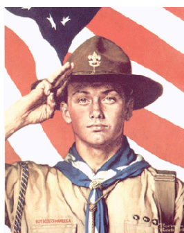
Schilderij over Scouting van Norman Rockwell

wassene, nl aan: De onbekende Londense Scout omdat men meende dat zonder zijn optreden Scouting wellicht niet in een zo vroeg stadium de Verenigde Staten zou zijn geïntroduceerd. 2)