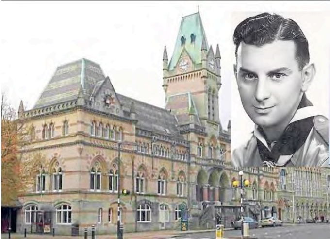
Guild Hall Winchester (VK) 2015

nodig te hebben, waarop hij zei dat het er 1500 moesten zijn. Alleen al voor het koor had hij er 300 nodig.