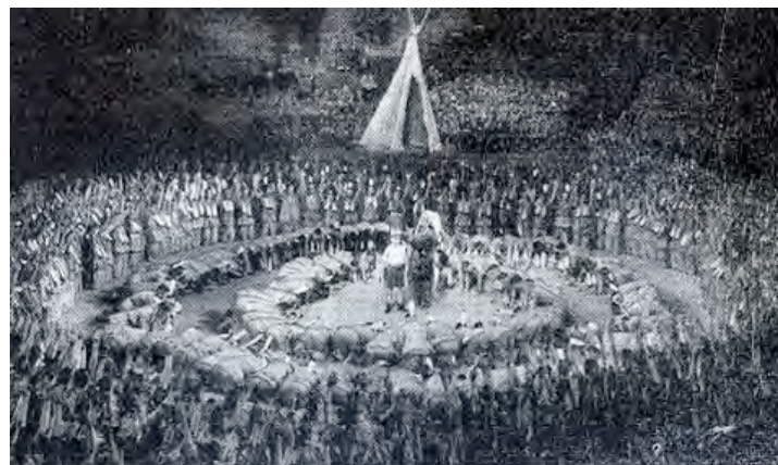
Rondom de Boy en het Opperhoofd, de dans en de song van de indianen