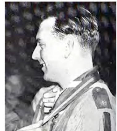
De zilveren wolf

In juni 1936 was de Royal Albert Hall gedurende zeven avonden totaal uitverkocht. Met busladingen vol kwam het publiek uit heel Engeland. Op de eerste avond, waarbij de Baden-Powells en hun kinderen aanwezig waren, kreeg de groep na de grote finale een donderend applaus en dit herhaalde zich iedere avond. Zo zeer dat men besloot de show in 1938 te herhalen. Weer met groot succes. Gevolg was dat er in de zomer van 1939 opnieuw werd gewerkt aan een herhaling. Maar het uitbreken van de Tweede Wereldoorlog in september 1939 betekende uiteraard ook het einde van BOY SCOUT.