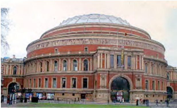
De Royal Albert Hall

Daarop legde de Boy de Belofte af, kreeg zijn installatieteken en groepsdas. Waarop de verkennersleider verklaarde dat hij nu een Scout was, lid van de groep maar ook van de Wereldbroederschap van Scouts. Koor en orkest vielen in en zongen Now as I start upon my chosen way, grant as I promise - courage new for me to be the best - the best that I can be..... en Lift up your hearts. Brothers are we, ever to be, All through the wide, wide World, United as one. Daar het publiek deze songs al kende zong de hele zaal mee.