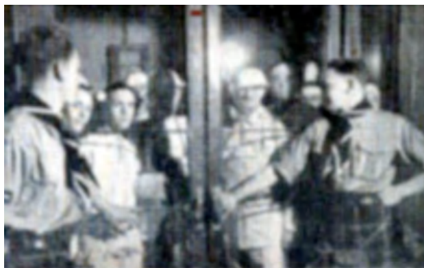
De honderden 'Ghosts' wachten op het moment waarop zij via de trappen de arena kunnen betreden.