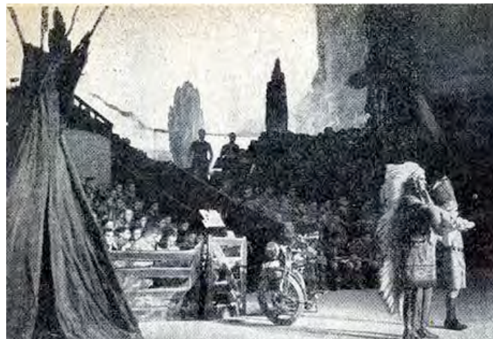
De BOY, het Indiaanse Opperhoofd, de motorfiets en een deel van het koor en orkest.