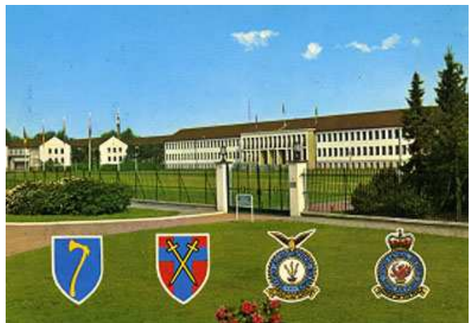
Hoofdkwartiergebouw in het Centrum

burgerpersoneel en hun gezinnen. Hier bevonden zich ook scholen, bioscopen en een theater. Belastingvrije winkels van de NAAFI, kerken en pubs en in het zuiden sportvelden. De hoofdstraat, die het complex doorsneed van West naar Oost heette de Queen's Avenue. Alle straten hadden Engelse namen maar ook waren er twee die genoemd waren naar de Nederlandse Admiralen De Ruyter en Tromp. Er stonden Engelse telefooncellen en brievenbussen. Het geheel was omringd door prikkeldraad en bezoekers dienden in het bezit te zijn van een "permit" om er binnen te komen. Ze dienden zich te melden bij de officiële ingangen die bewaakt werden door de militaire politie. Eenmaal binnen de hekken hadden die bezoekers dan ineens niet meer de idee in Duitsland te zijn maar in een Brits stadje. De officiële militaire naam was Rheindahlen Headquarters maar door de bewoners en bezoekers werd het ook Elizabethtown genoemd. Toen het openbaar vervoer van de stad Mönchengladbach weer op gang kwam onderhield dit met bussen een dienst tussen het Hauptbahnhof en HQ met op de koersborden – zeer verwarrend – Rheindahlen HQ, Hauptquartier of Elizabethtown.