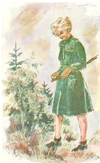
Een groene padvindster