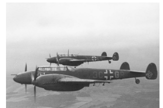
Duitse jager: Messerschmitt

Er werden 20.000 exemplaren van Schellenbergs handboek gedrukt maar ze werden gelukkig nooit gebruikt. De voorraad werd opgeslagen in een pand dat tijdens een bombardement op Berlijn aan het einde van de oorlog in vlammen opging. Bijna alle exemplaren gingen verloren. De Engelsen hadden van het bestaan van het boek waarschijnlijk niet afgeweten als de Britse strijdkrachten, bij hun opmars in Duitsland, niet een exemplaar hadden aangetroffen in een verlaten Gestapobureau . Kennelijk vonden de Britse autoriteiten het een dermate beladen boek dat het als Top Secret werd opgenomen in de Britse archieven en het bestaan ervan pas in 2000 werd geopenbaard.