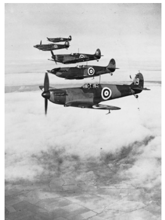
Engelse jager: Spitfire