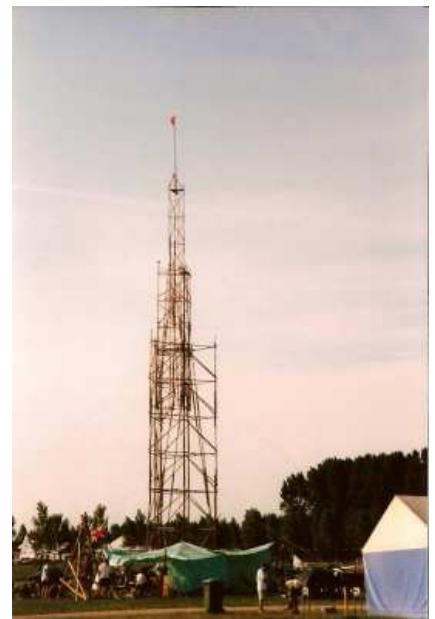
De toren van 65 meter hoog

Net als in 1937 in Vogelenzang was ook hier sprake van een ruime Koninklijke belangstelling voor dit Scoutinggebeuren. Hoewel op dat moment Prins Claus beschermheer van Scouting Nederland was, werd de opening van de Jamboree verricht door Koningin Beatrix. Ze werd door Prins Claus vergezeld en ook door koning Karl Gustav van Zweden, die zich – net als in 1937 zijn vader Gustav Adolf – ook nog als deelnemer aan de Jamboree had laten inschrijven. Het motto van de jamboree was 'Future is Now'. Om het heden en de toekomst te laten samenvallen, dat valt nog niet echt mee. Maar misschien moet het pionieren van een 65 meter hoge toren (hij moest in het 'Guinness Book of Records') als een bijdrage aan dit pogen gezien worden. Wat mezelf betreft: Ik had me sinds het midden der zestiger jaren eigenlijk niet meer zo met scouting beziggehouden. Maar een Jamboree in Nederland, dat wou ik toch wel eens zien.