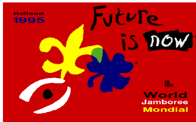
Het logo van de jamboree van 1995

Het Verenigd Koninkrijk buiten beschouwing gelaten, komt het niet voor dat landen twee maal het verzoek krijgen om een Wereldjamboree te organiseren. Dat Nederland het verzoek wel kreeg om, na 1937, in 1995 dat nogmaals te doen is dus alleen daarom al opmerkelijk. Een andere opmerkelijkheid was dat het de eerste Jamboree was, waaraan ook meisjes deelnamen. Tot dan was een Jamboree een jongensaangelegenheid.